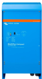
MultiPlus Compact 12/2000/80

Des logiciels sophistiqués (VE.Bus Quick Configure et VE.Bus System Configurator) sont disponibles pour configurer plusieurs fonctions nouvelles et perfectionnées.