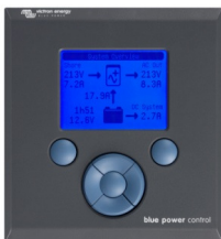
Tableau de commande Blue Power

Une solution pratique et bon marché pour une surveillance à distance, avec un bouton rotatif pour configurer les niveaux de Power Control et Power Assist.